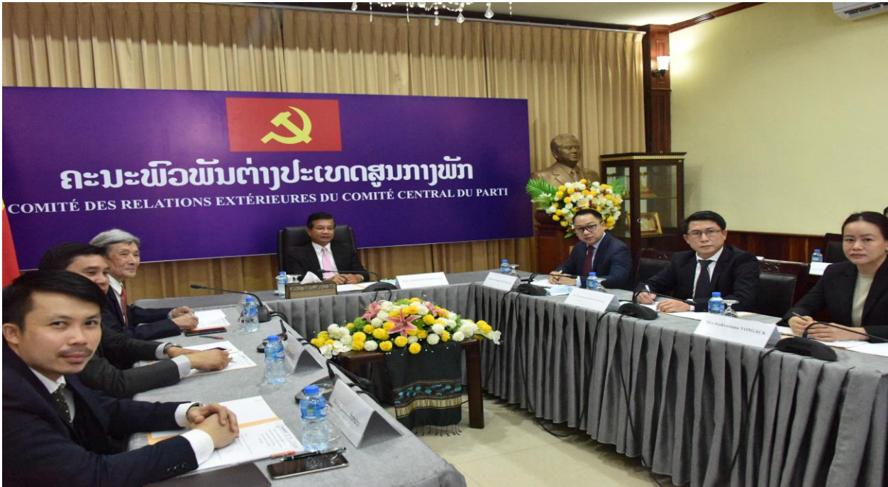
ໃນວັນທີ 16 ມິຖຸນາ 2021 ຄະນະຜູ້ແທນພັກ ປປ ລາວ ນໍາໂດຍ ສະຫາຍ ສິມພອນ ສີຈະເລີນ, ຮອງຫົວໜ້າ ຄະນະ